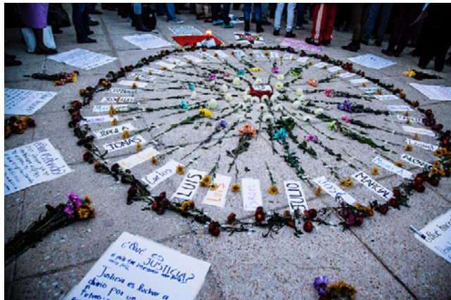
Acció de protesta contra la desaparició de 43 estudiants a Ayotzinapa, Guerrero, l'any 2014.